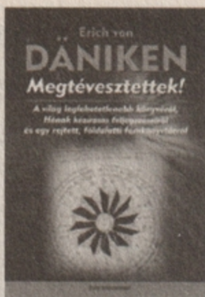
Erich von Däniken Megtévesztettek! 3495 Ft