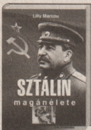
Lilly Marcou Sztálin magánélete 3495 Ft