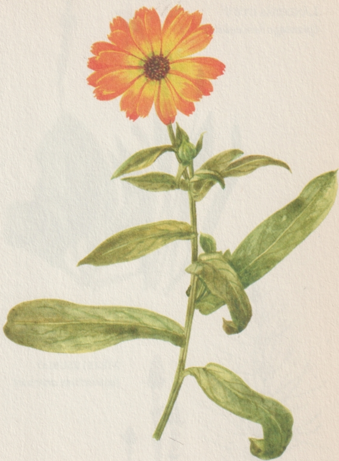
KÖRÖMVIRÁG ( calendula officinalis )