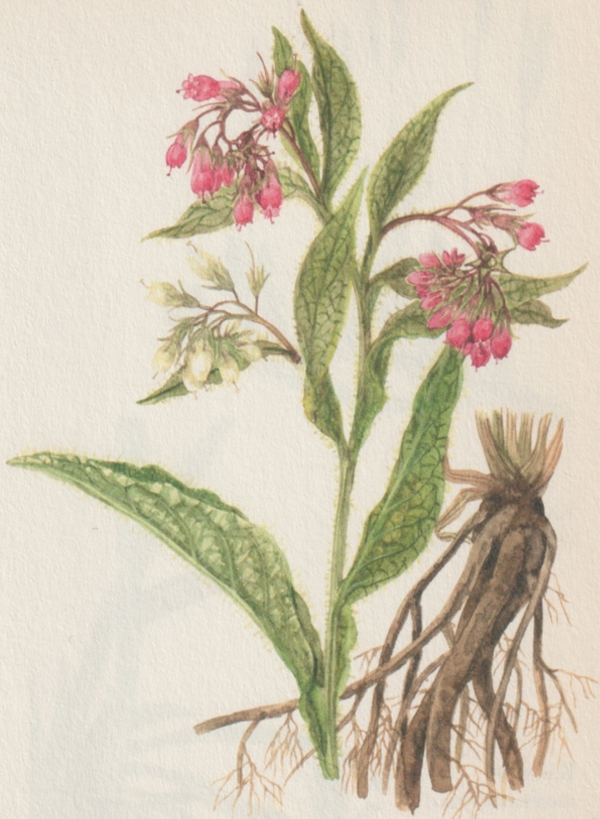
FEKETE NADÁLYTÓ ( symphytum officinale )