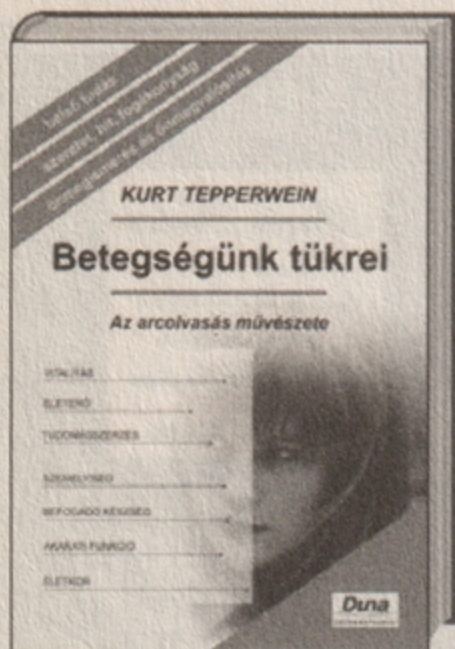
Kurt Tepperwein Betegségünk tükei 2495 Ft