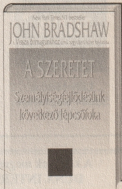
John Bradshaw A szeretet 2495 Ft