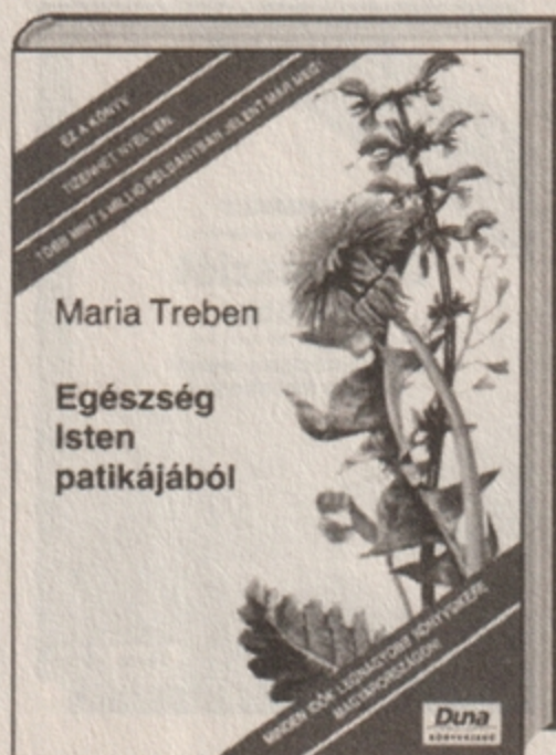
Egészség Isten patikájából 2495 Ft