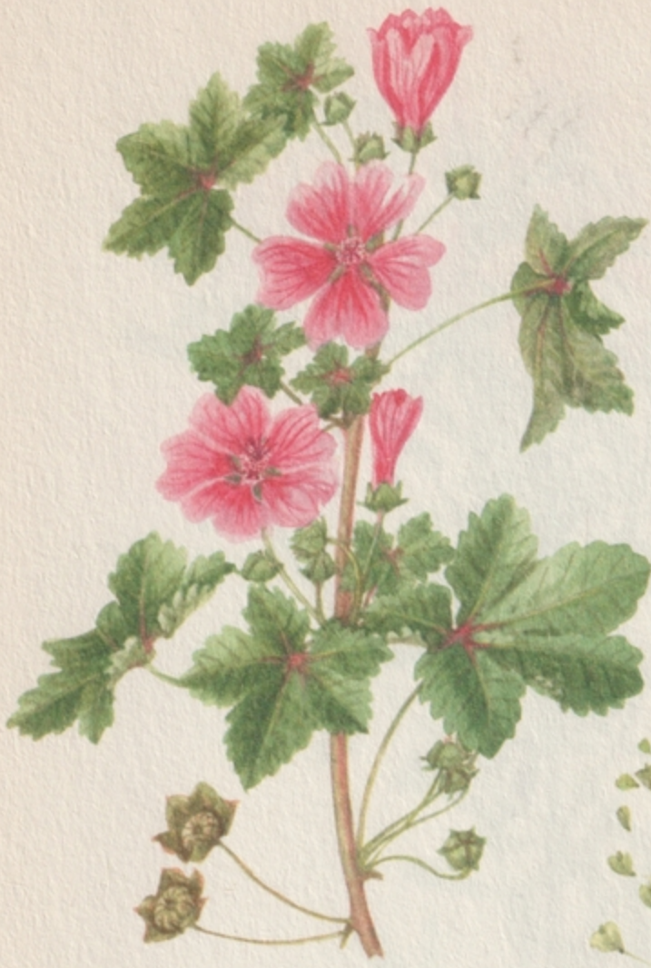
PAPSAJTMÁLYVA ( malva neglecta )