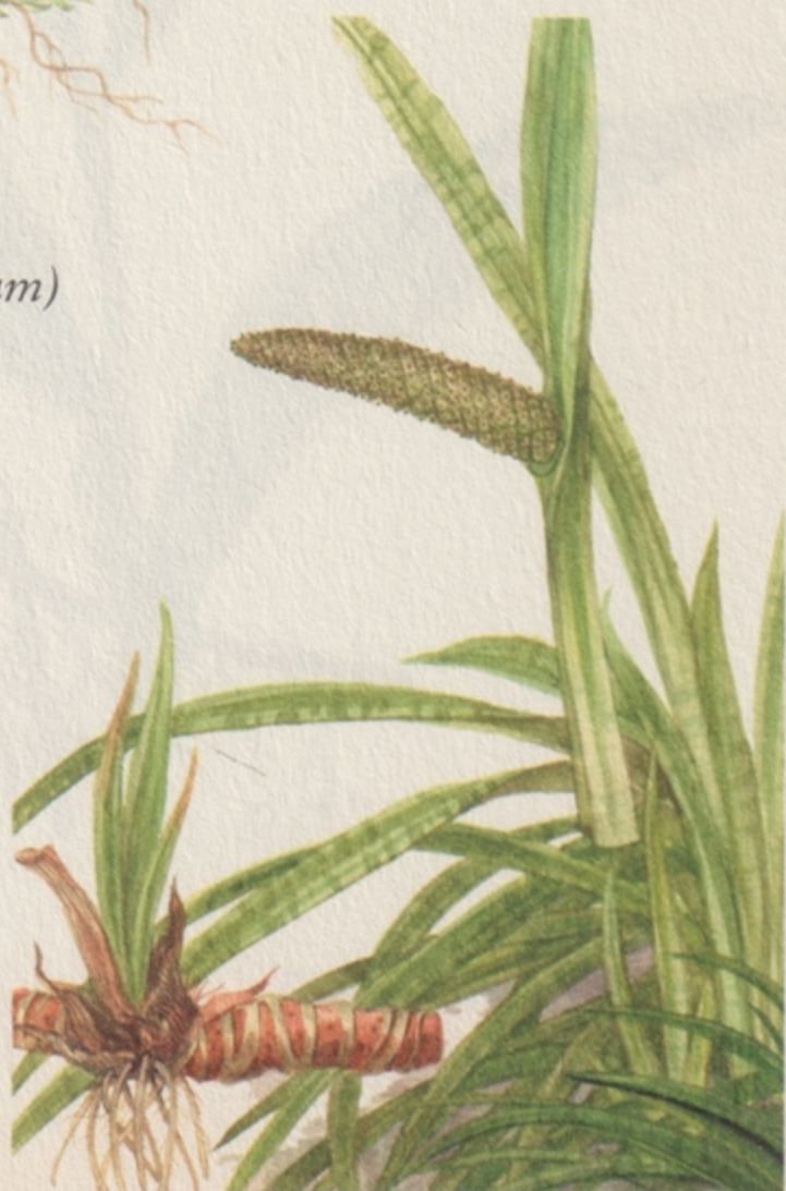
KÁLMOS ( acorus calamus )