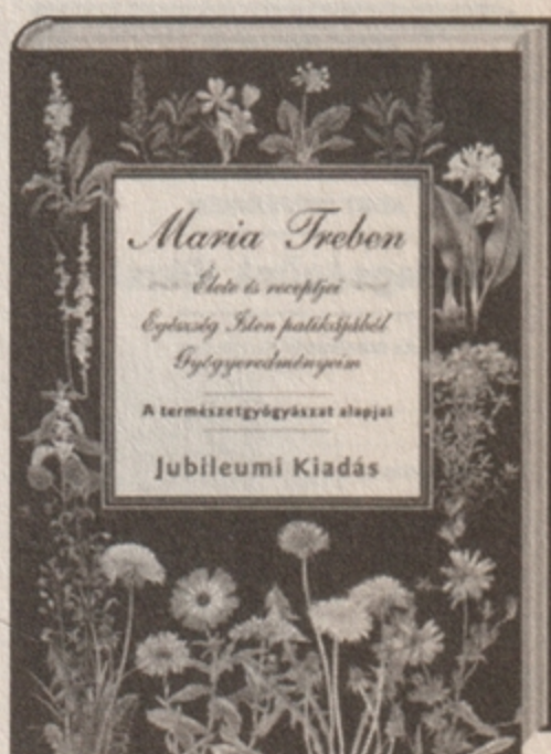
Jubileumi kiadás 8998 Ft