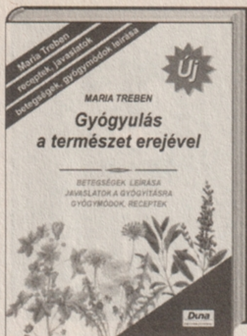
Gyógyulás a természet erejével 2198 Ft