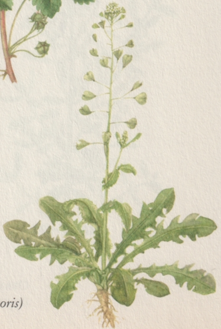
PÁSZTORTÁSKA ( capsella bursa pastoris )