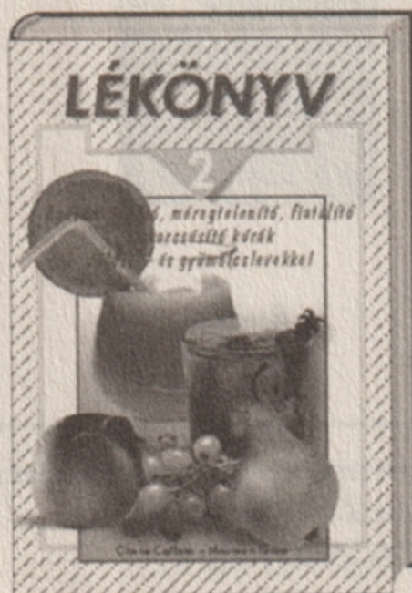
C. Calbom – M. Keane Lékönyv 2. 2495 Ft