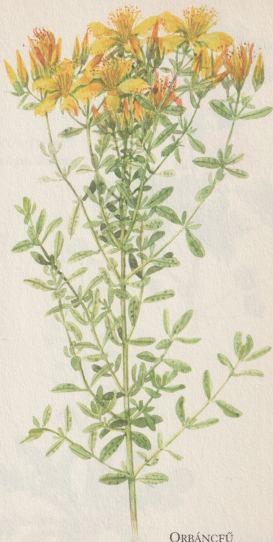
ORBÁNCFŰ ( hypericum perforatum )