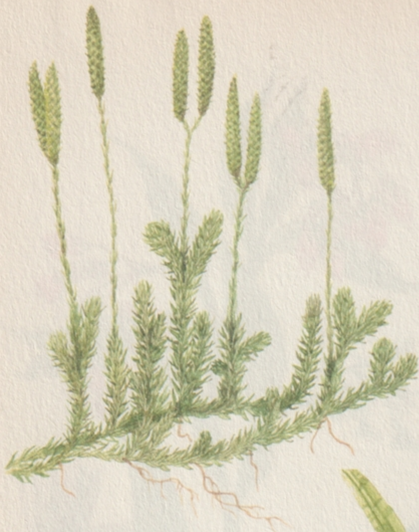
KAPCSOS KORPAFŰ ( lycopodium clavatum )