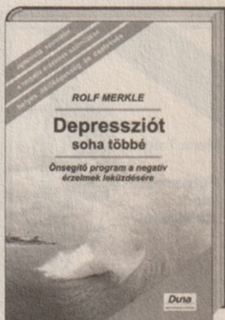
Rolf Merkle Depressziót – soha többé 2495 Ft