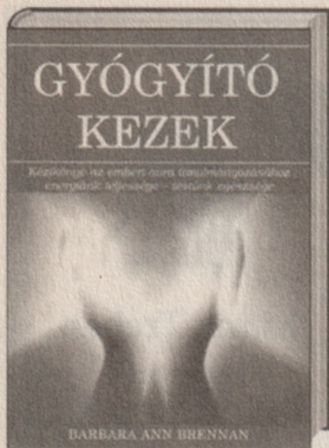
Barbara Ann Brennan Gyógyító kezek 2998 Ft