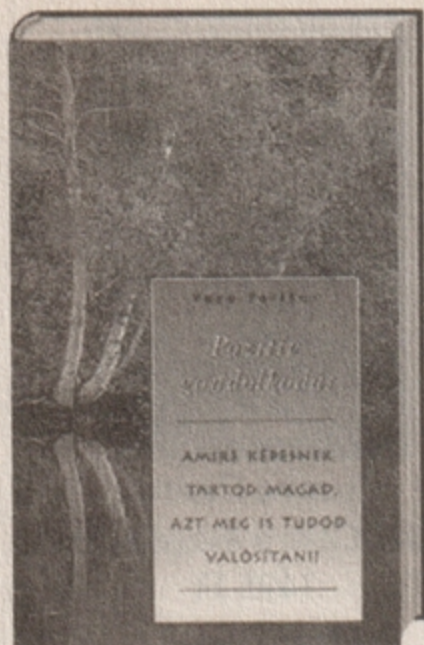
Vera Peiffer Pozitív gondolkodás 2495 Ft