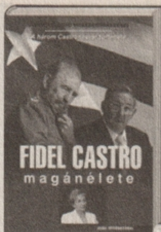
Juanita Castro Fidel Castro magánélete 3495 Ft