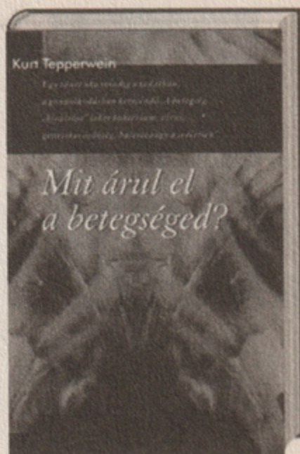
Kurt Tepperwein Mit árul el betegséged? 2495 Ft