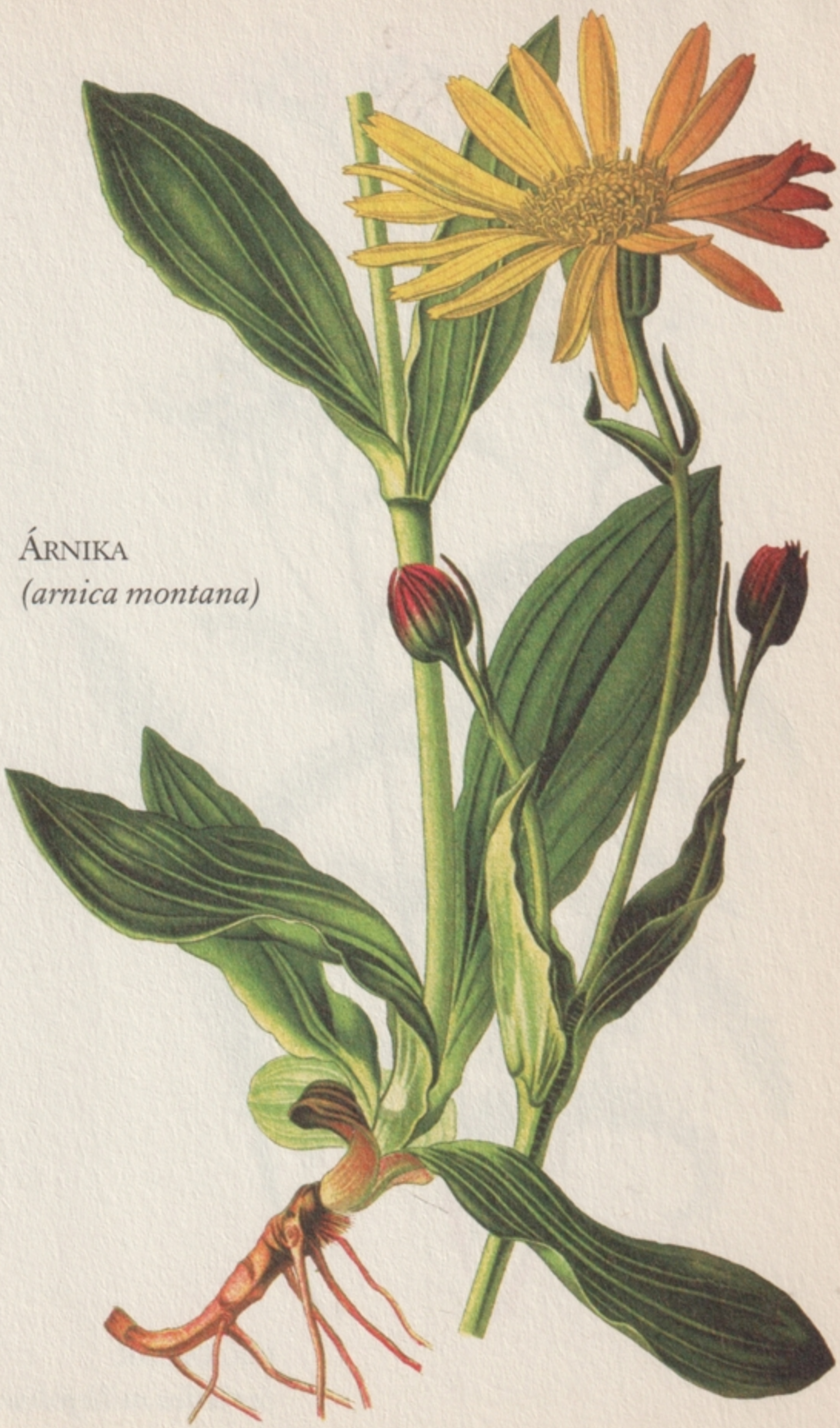
ÁRNIKA ( arnica montana )