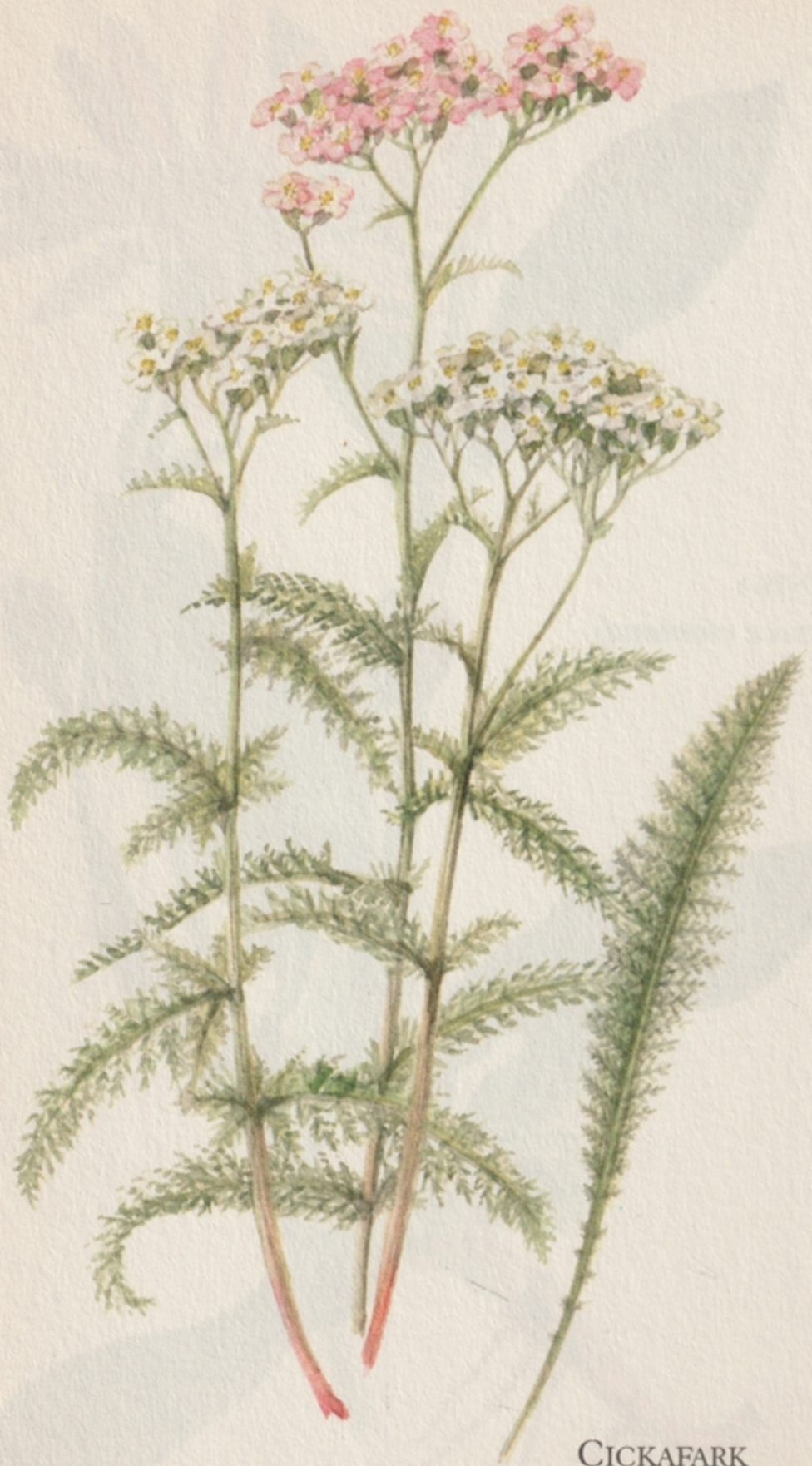
CICKAFARK ( achillea millefolium )