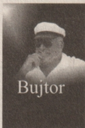
Bujtor 3995 Ft

A könyvek megrendelhetők a kiadónál, DUNA INTERNATIONAL KFT.